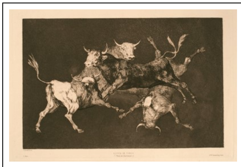
Goya, Lluvia de toros

masques rituels, des danses sacrées où l'individu qui veut se mettre en relation avec une surnature ou avec une puissance supérieure se masque pour l'affronter ou pour l'imiter. Et le Portrait de l'artiste en saltimbanque faisait simplement une sorte de rassemblement d'images que l'on peut aisément prélever dans diverses civilisations, et surtout à diverses époques de l'histoire occidentale. Il en résulte parfois une grande joie de voir ce qui est constant, ou ce qui est novateur. La collection dont j'avais à m'occuper comme responsable pendant un temps, alors que j'étais étudiant en médecine et que je commençais d'écrire, m'a permis de faire collaborer à cette série d'ouvrages Michel Butor d'un côté, Yves Bonnefoy, Roland Barthes avec son voyage au Japon ; le groupe d'amis que j'avais à l'époque a pu s'exprimer à Genève par les soins de cet admirable manieur d'images qu'était Albert Skira.